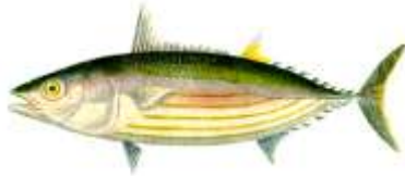
BONITO ( Euthynnus pelamys )

Der BONITO ist ein Thunfisch. Er liebt klares Wasser und das große weite Meer, ist für die Welternährung wichtig